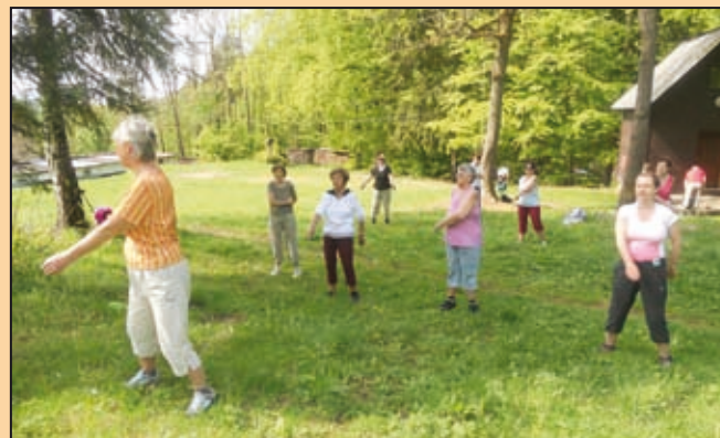
Jizerské hory, Montanie