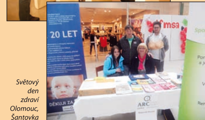
Světový den zdraví Olomouc, Šantovka