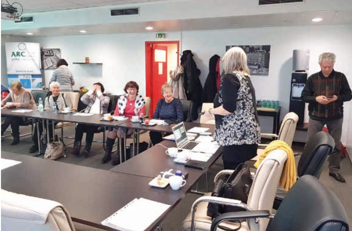
Ze semináře konaného 4. února 2020 v Praze