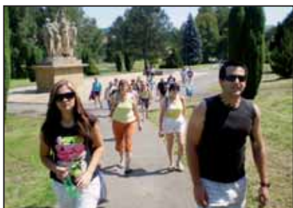
Z milého setkání s Leošem Marešem máme věnování pro naše čtenáře.