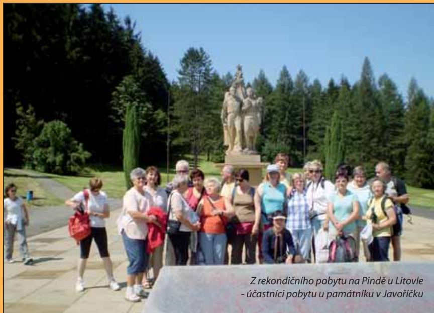
Z rekondičního pobytu na Pindě u Litovle - účastníci pobytu u památníku v Javoříčku