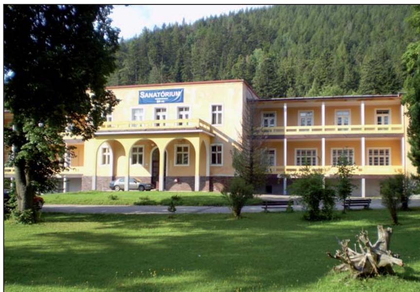
Sanatorium Tatranská Kotlina - Turistická ubytovna