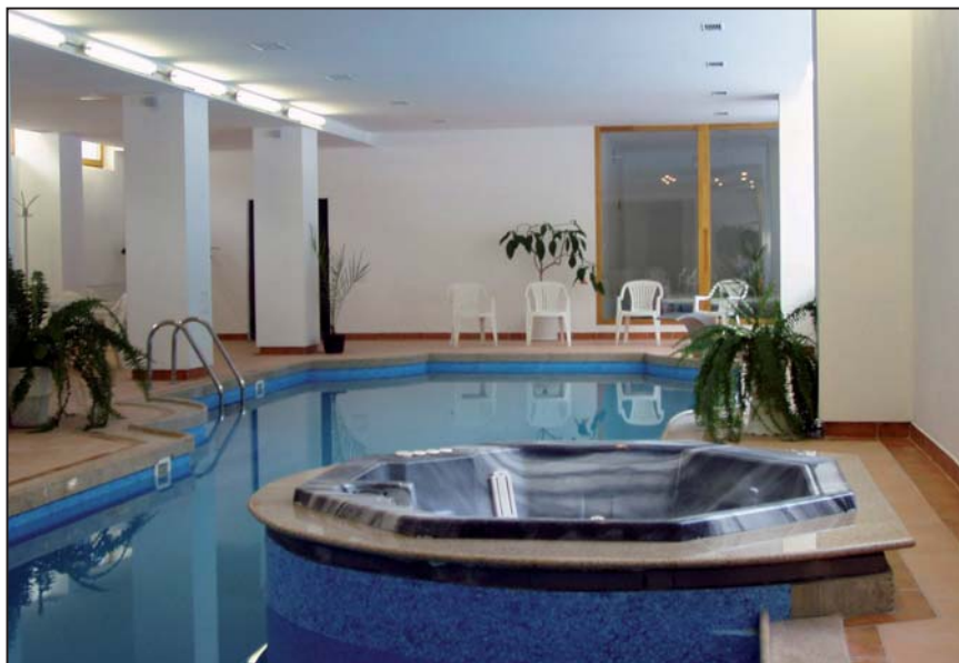
Sanatorium Tatranská Kotlina - Vodný svet