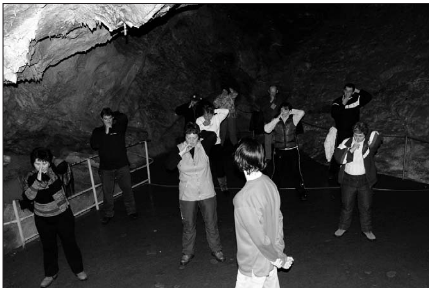
Cvičení v Belianskej jaskyni

Pokud pojedete individuálně, musíte si vyměnit peníze na cestu, protože ve vlaku a v autobusech po Slovensku se hradí pouze ve SK.